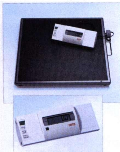
EPU tip SECA 472